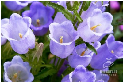
カンパニユラ 感謝・誠実