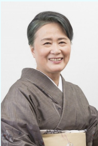
夏井 いつき 俳人

昔のことですが、吟行をしながら頭の中で言葉をこねくり回してウンザリしたことがありました。その時、墓石の隙間に生えるスマレがふと目に留まり、瞬間、ハッとしました。自分の脳味噌から出てくる言葉は自分以下のものではない、スマレや石、風、空のほうが私の灰色の脳細胞よりも、よっぽど新鮮な情報を持っていることを教えられたのです。五感を働かせることで、そんな体験をすることも少なくありません。