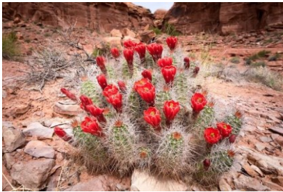
サボテン 偉大/温かい心