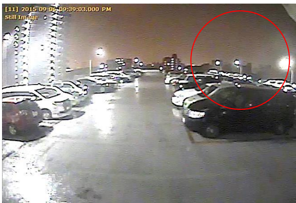
9月6日(日)21時37分ごろに千葉市中央区今井町一帯を襲った竜巻の映像。

発生時に電線のショートと見られる電光が一瞬起こり、その右側に竜巻のようなものが確認できる。 北東に進んだ後、線路を越えた辺りで消滅。付近は一時停電となった。