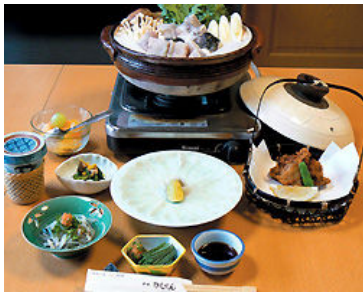
ふぐコース (8,500 円)