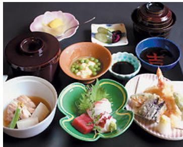
昼食膳 (2,200 円) 予約なしOK