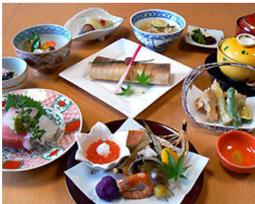
おまかせコース (5,500 円)

京都の名店『ぎおん畑中』で修行されただけあって料理は全てお勧めです。店主の腕と性格がそのまま料理に現れ、優しく温かく柔らかい絶妙な味が楽しめますよ。お昼は手ごろな価格でランチがあります。市原市を代表する『料理かもせん』に是非一度足を運んでかもせんの味を堪能なさってください。忘年会、新年会の予約受付中。(バス送迎あり)