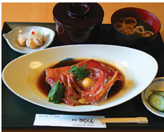
その日のランチ魚定食 (940 円～)